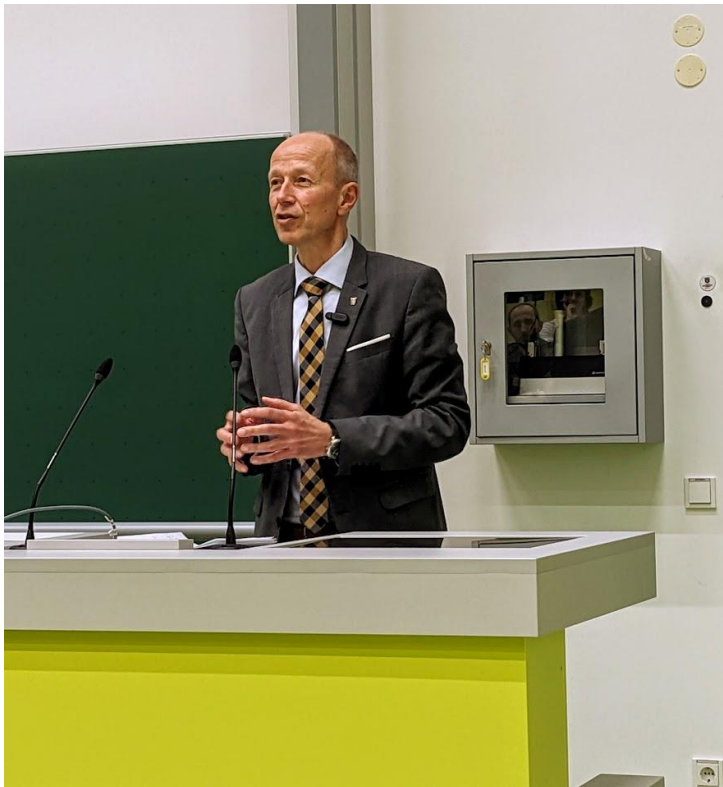
Die Veranstaltung begann mit einer herzlichen Begrüßung durch den Hessischen Minister für Kultur, Bildung und Chancen, Armin Schwarz.